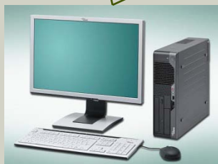
naturaSign de StepOver